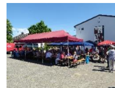
Grillfest am 1. Mai in Heftrich