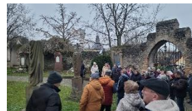
Fahrt zum Weihnachtsmarkt nach Ingelheim