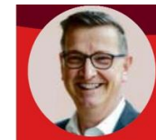
Unser Vertreter im Bundestag Martin Rabanus